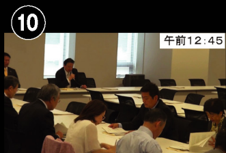
⑩ 午前12:45 再び会館内を移動して 10回目の会議 経済産業省部門会議へ出席