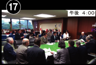
⑲ 午後 4:00 UR自治会の皆さんと 「前田武志」国土交通大臣を訪問