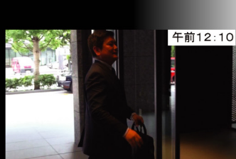
午前12:10 キャピトル東急ホテル 7回目の会議で ゆっくり会食する間もなく移動