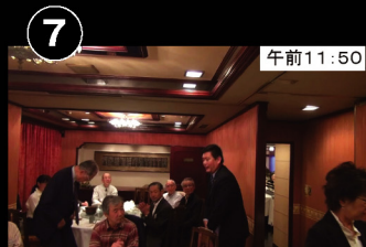
⑦ 午前11:50 銀座 月に1度の高校同窓会の昼食会へ出席