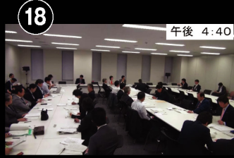
㉒ 午後 4:40 議員会館会議室 経済連携プロジェクト㉒へと出席