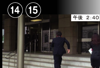
⑮ 午後 2:40 青少年特別委員会⑭と 消費者問題特別委員会⑮へ出席