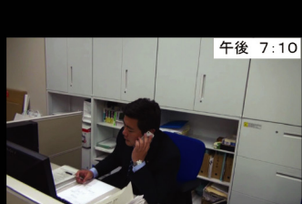
㉗ 午後 7:10 ではなく、再び机に向かって 今日一日の記録や、書類の整理