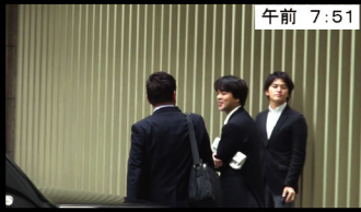
午前 7:51 宿舎玄関前 宿舎前には記者がいっぱい 情報交換しながら議員会館へ