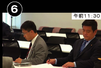
⑥ 午前11:30 自動車戦略ワーキングチームへ出席