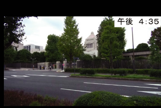
㉑ 午後 4:35 国会議事堂前を通り過ぎて 議員会館へ入ります