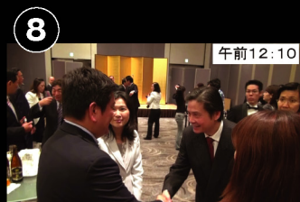
⑧ 午前12:10 議員連盟で台湾からのお客様と懇談 大学時代の同級生が台湾の高雄市長に