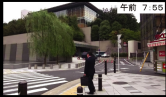
午前 7:55 首相官邸前を通り過ぎて 宿舎から議員会館へは徒歩5分!