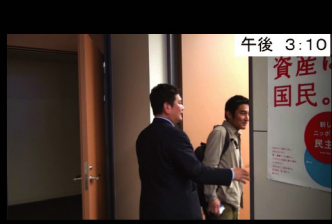
⑯ 午後 3:10 森山事務所 事務所に再び帰ってきました