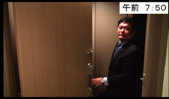
午前 7:50 早い日は朝7:00からの朝食会 普段は朝8:00から勉強会がスタートします