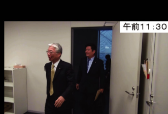
午前11:30 この日5回目の会議から 6回目の会議のため別会議室へ移動