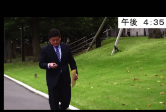
⑳ 午後 4:35 議員会館会議室へ移動中 普段 永田町内は徒歩で移動しています