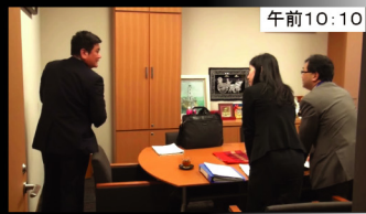
午前10:10 引き続いて、3回目の会議