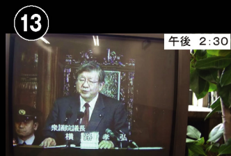
⑬ 午後 2:30 本会議場 いよいよ衆議院本会議が開会 会議は始まっていますが、カメラは入れま せんので、会議室前のモニタ映像です