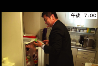
㉖ 午後 7:00 森山事務所 これで今日もお疲れ様……