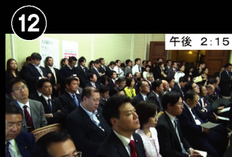
⑫ 午後 2:15 終了後すぐ、代議士会へ出席 本日すでに12回目の会議となります