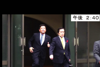
⑭ 午後 2:40 急いで第4会議室へ 次いで第14会議室へ移動