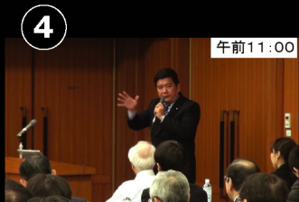
④ 午前11:00 日本水フォーラムのシンポジウム会場へ 民主党水政策プロジェクトチーム事務局長 として挨拶