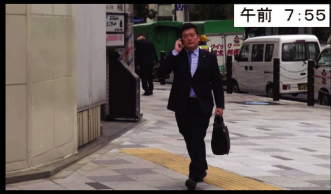
午前 7:55 議員会館へ移動中