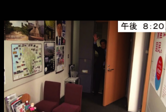
㉙ 午後 8:20 お疲れ様でした 体には気をつけて行ってらっしゃい!