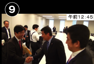
⑨ 午前12:45 議員会館会議室 9回目の会議 東日本大震災復興・復興検討PTへ出席