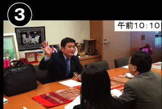
③ 午前10:10 外務省北米第一課長からPOW (米国人元戦争捕虜)について説明を受ける