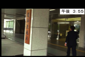
⑱ 午後 3:55 国土交通省 本日17回目となる会議の会場へ