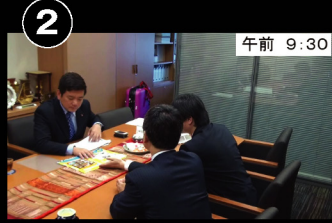
② 午前 9:30 森山事務所 終了後事務所へ急いで移動、 2回目の会議 地域づくりに取り組む企業 の方から事業説明を受けました