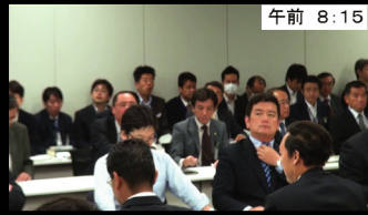
午前 8:15 この日は成長戦略・経済対策プロジェクト 総会 久しぶりの開催でたっぷり1時間以上