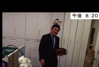
㉘ 午後 8:20 そして、地元支援者と会食へ…… ※多いときには夕食3回という日も!