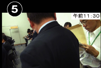
⑤ 午前11:30 議員会館会議室 WTO・FTA・EPA検討ワーキングチーム として挨拶