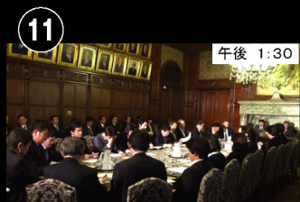
⑪ 午後 1:30 衆議院議長応接室 本日11回目の会議 臨時国会 衆議院本会議開会前の議院運営 委員会が行われます