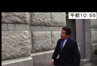
午前10:55 日本橋公会堂 本日4回目の会議へ急ぎます