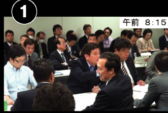
① 午前 8:15 衆議院第2議員会館 会議室 今日のはじめての会議が始まります